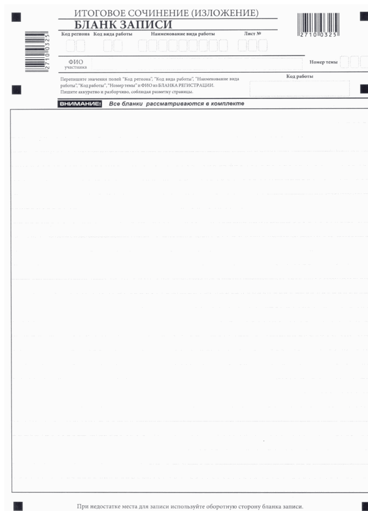
Рис. 5. Лицевая сторона двустороннего бланка записи